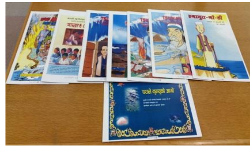
アジア8か国津波防災教材『稲むらの火』