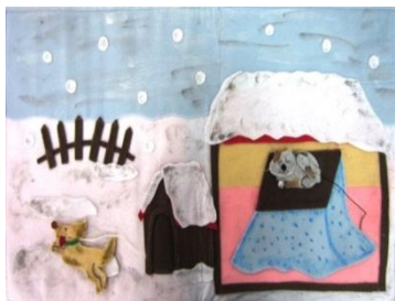
わらべ歌布絵本『雪』