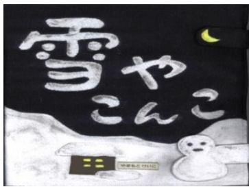
わらべ歌布絵本『雪やこんこ』