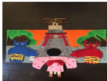
わらべ歌布絵本『とおりゃんせ』