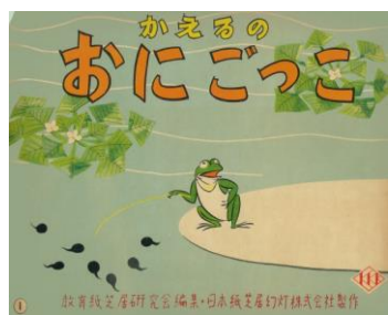
「かえるのおにごっこ」1953年