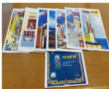
アジア8か国津波防災教材 「いなむらの火」