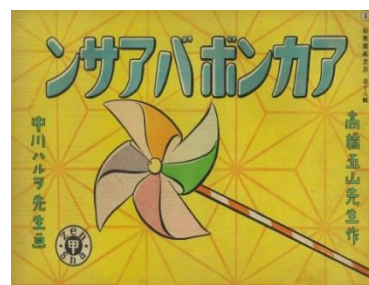
「あかんぼばあさん」1940年